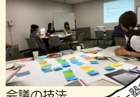
会議の技法 (リーダー塾)